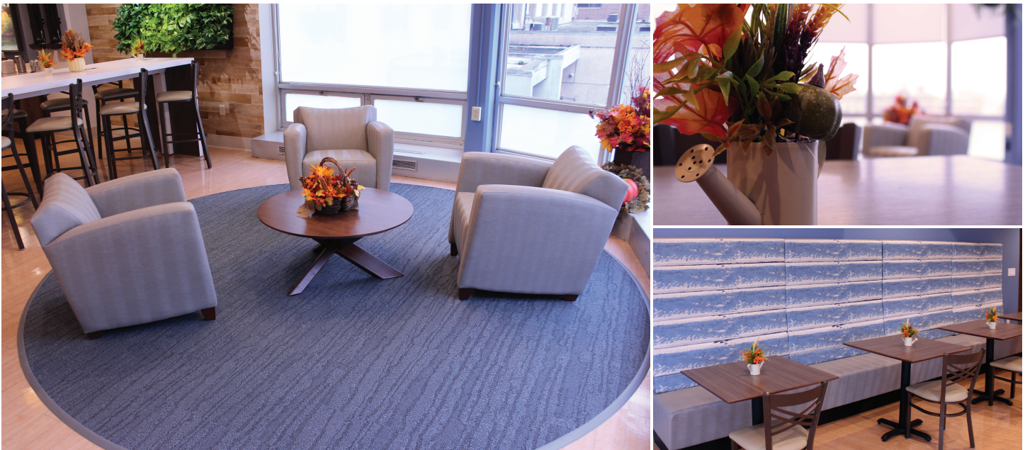
The Merrimack Café

Hay máquinas vendedoras de alimentos en el sótano, el subsótano y el 4.º y 5.º piso, cerca de los elevadores Hamblet, de color azul. En el primer piso, justo después de la recepción principal, hay otras opciones.